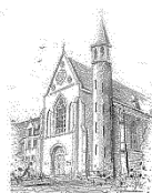
Parochie O.L.V. Onbevleekt Ontvangen Zenderen